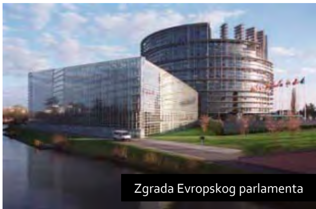
Zgrada Evropskog parlamenta

EP je sredinom marta objavio studiju o „spoljnoj dimenziji“ politika Evropske unije (EU) u prostoru slobode, bezbednosti i pravde, kao i o trenutnim aktivnostima i razvoju Haškog programa za jačanje slobode, bezbednosti i pravde u EU. Evropski savet je usvojio Haški program 4. novembra 2004. Nekoliko nedelja kasnije Evropska komisija i Savet, su objavili izjavu ( Communication ) vezanu