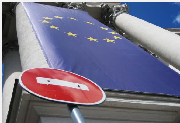
(Radio Slobodna Evropa)

Najrelevantnije poglavlje za dalji tok reforme policije je Poglavlje 24 – Pravda, sloboda i bezbednost zbog čega ukratko prenosimo iskustvo Crne Gore u pripremi odgovora na ova pitanja. Zanimljivo je da je Upitnik Evropske komisije koji je upućen Crnoj Gori imao najveći broj pitanja iz oblasti pravosuđa i unutrašnjih poslova, što je bilo suprotno očekivanjima crnogorskih vlasti.