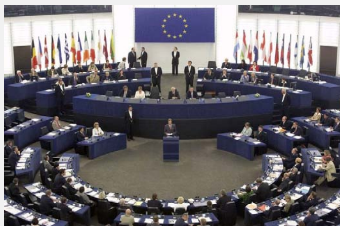
Zasedanje Evropskog parlamenta

prodaje ili transfera novca. To znači da SWIFT upravlja oko 15 miliona transakcija dnevno u kojima milijarde novčanih jedinica menjanju vlasnike. Sjedinjene Američke Države (SAD) su posebno nakon 11. septembra postale vrlo zainteresovane za dobijanje tih podataka kako bi se efikasnije suprotstavile finansiranju terorizma. Belgijska kompanija omogućila je SAD pristup bankovnim podacima, ali niko u Evropi nije znao ništa o tom dogovoru. Prvo su se oglasili nemački konzervativci zabrinuti zbog toga šta može da se desi sa tolikom količinom ličnih podataka.