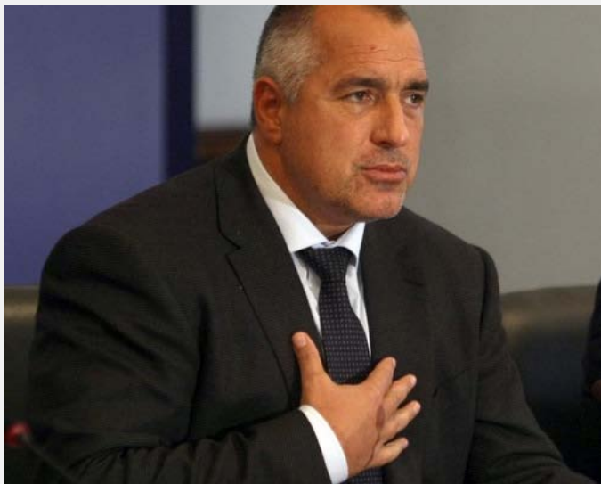
Bojko Borisov, premijer Bugarske

vođenju licu pravde svih slučajeva organizovanog kriminala i korupcije u zemlji.