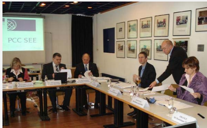
Sastanak u Ljubljani

Konvencija o policijskoj saradnji u Jugoistočnoj Evropi (PCC SEE) jedan je od najznačajnijih međunarodnih dokumenata za pravosudnu i policijsku saradnju u Jugoistočnoj Evropi. Odredbe Konvencije predstavljaju dobar pravni okvir za stvaranje efektivnog sistema prekogranične saradnje, kao i za svestranu policijsku saradnju država potpisnica (Albanije, Bosne i Hercegovine, Bugarske, Crne Gore, Makedonije, Moldavije, Rumunije i Srbije). Konvencija uključuje i mnoge odredbe policijske saradnje koje se već nalaze u Šengenskom sporazumu. Zbog toga se PCC SEE može razumeti kao „pripremna nastava“ za ulazak ugovornih strana u šengensko područje. Glavnu ulogu u sprovođenju odredaba PCC SEE ima Sekretarijat sa sedištem u Ljubljani, u predstavništvu Ženevskog centra za demokratsku kontrolu oružanih snaga (DCAF). U novembru 2009. godine u Sekretarijat je upućen i oficir za vezu iz Srbije čime je MUP RS pokazalo volju da doprinese daljem sprovođenju konvencije.