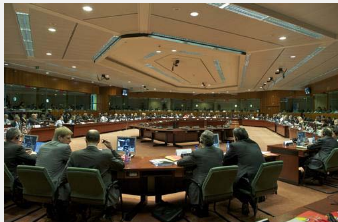
Pogled na sastanak Saveta za pravosuđe i unutrašnje poslove ( The Council of the European Union )

zbednosti, a ne samo njenim efektima“. Integrisani pristup bezbednosti treba da postane prepoznatljiva odlika evropskog modela bezbednosti u odnosu na pristupe drugih bezbednosnih aktera u svetu. Ovaj pristup podrazumeva objedinjene akcije saradnje organa za sprovođenje zakona, pravosudne saradnje, upravljanja granicama i civilne zaštite u skladu sa zajedničim evropskim vrednostima, kao što su poštovanje ljudskih prava.