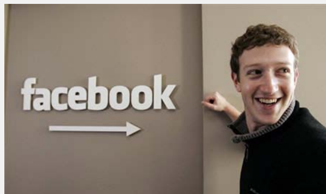
Mark Cukerberg, osnivač Fejsbuka

Na početku 2010. godine odigralo se niz događaja koji su postavili „privatnost“ na onlajn društvenim mrežama kao temu broj jedan, čime su izazvane različite nedoumice i reakcije među korisnicima mreža, ali i zvaničnim vlastima. Debata je započeta izjavom Marka Cukerberga (Mark Zuckerberg), osnivača onlajn mreže Fejsbuk, da je sa privatnošću na internetu završeno, te da se korisnici društvenih mreža i ne opterećuju time koliko su njihovi lični podaci bezbedni. Ova vrlo direktna ocena zapravo je predstavljala pokušaj Cukerberga da opravda nedavne promene politike privatnosti njegove kompanije kojom su informacije na profilima korisnika postale inicijalno dostupne, na taj način smanjujući kontrolu koju korisnici imaju nad svojim ličnim podacima.