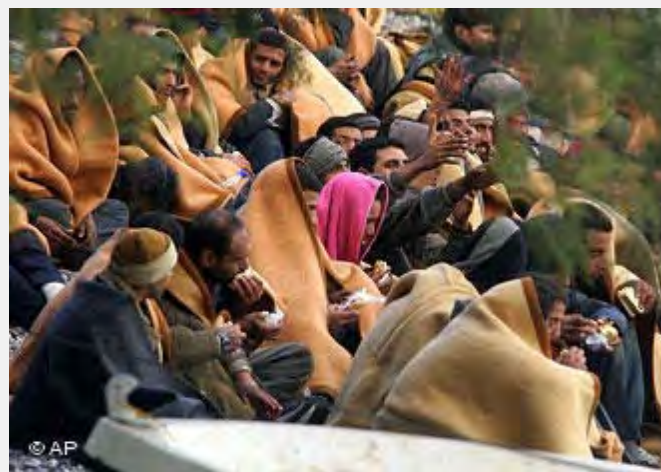
Ilegalni migranti kroz Tursku u EU

Ekonomska kriza i snažnije kontrole granica glavni su razlozi pada broja ilegalnih imigranata koji dolaze u EU, saopštila je Evropska agencija za upravljanje operativnom saradnjom na spoljnim granicama država članica (FRONTEX). Ukupno je pronađeno 106.200 ilegalnih imigranata na evropskim morskim i kopnenim granicama prošle godine, što je 33 odsto manje nego godinu ranije, rekao je Gil Fernandez, pomoćnik direktora FRONTEX.