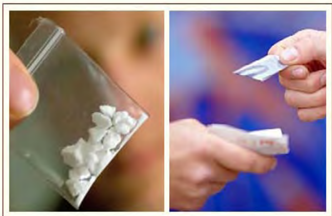
Preuzimanje narkotika

U paktu su istaknuta tri vodeće smernice za delovanje. Razbijanje „kokainskih ruta“ trgovine razmenom informacija sa već uspostavljenim centrima EU u Zapadnoj Africi u Gani i Senegal, pružanjem analiza kroz EUROPOL, kao i uspostavljanjem saradnje između EUROPOL i misije EU u Zapadnoj Africi u Gvineji Bisao. Pored razmene informacija sa tranzitnim državama, pakt je ponudio i tehničku pomoć državama Latinske Amerike i Kariba kao prostorima „porekla“ ilegalnih narkotika.