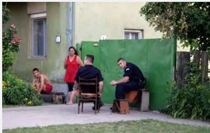
Policija čuva Rome u Jabuci kod Pančeva

Treba podsetiti da ovo nije prvi put da se situacija u kojoj je izvršilac krivičnog dela Rom, a žrtva neromske nacionalnosti, koristi za pozivanje na „linč“ romskog stanovništva. Slično se desilo 2009. godine u Kraljevu, ali je tada reakcija policije bila blagovremena, bar kada je u pitanju zaštita Roma od rasističkih napada.