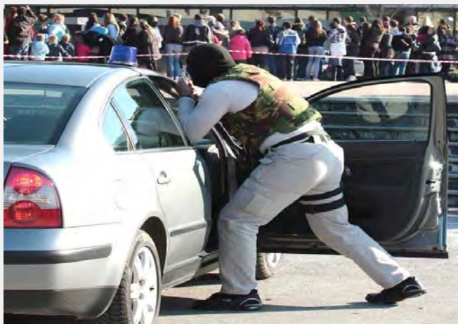
Demonstracija policije u borbu protiv organizovanog kriminala ( RCC.int )

anje razmene iskustava u borbi protiv korupcije, kao i da države članice Saveta treba sa pridaju veći značaj Regionalnoj antikorupcijskoj inicijativi. Borba i praćenje ilegalnih migracija ulaze u strateške prioritetne oblasti. U okviru ove teme je posebno istaknuta važnost odgovarajućeg sprovođenja sporazuma o readmisiji. U tom pogledu, Srbija bi trebalo da u narednom periodu potpiše sporazume o readmisiji sa Albanijom i Makedonijom, što je od izuzetne važnosti obzirom da najveći broj ilegalnih migranata dolazi preko Grčke na ove prostore. U ovom domenu, od Regionalne inicijative za migracije, azil i izbeglice (MARRI) traži se dalja izgradnja kapaciteta kako bi se državama članicama pružila bolja pomoć u produbljivanju saradnje. Na kraju ističe se da produbljivanje pravosudne i policijske saradnje treba da bude u skladu sa principima zaštite ljudskih prava.