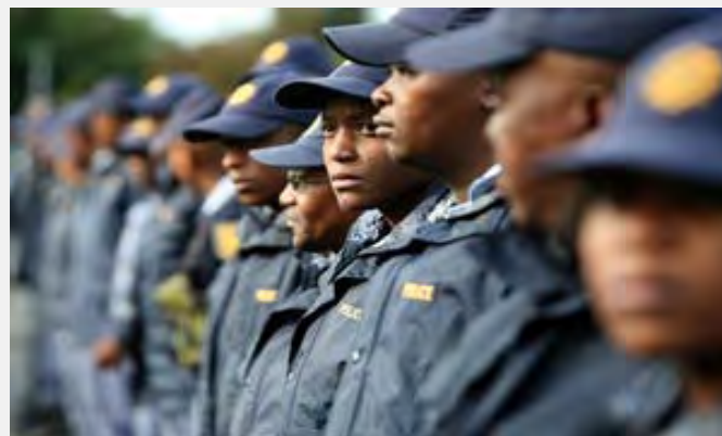
Policija u Južnoj Africi spremna za Svetsko prvenstvo u fudbalu 2010

larijama, te o obaveznosti javne dostupnosti preseka stečenih iskustava i izrade preporuka.