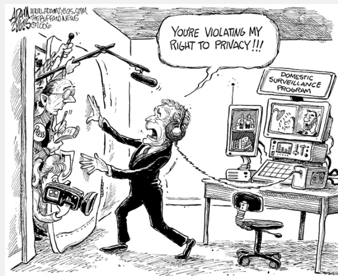
Kršenje prava na privatnost