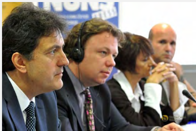
Konferencija u Medija centru (Mc.rs)

psihološku, psihijatrijsku, medicinsku, pravnu pomoć i edukaciju. Delimično je to urađeno aktivnostima organizacija civilnog društva – Beogradskog centra za ljudska prava, Helsinškog odbora za ljudska prava i IAN, kao i Zaštitnika građana. Aktivnosti su uglavnom odnose na nadgledanje stanja u zatvorima, policijskim stanicama i ustanovama socijalne i zdravstvene zaštite.