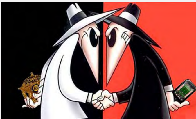
Elektronsko prisluškivanje

Ovde se javljaju dva problema. Najpre, telo za zaštitu tajnih podataka u Srbiji ne postoji, već su svi organi dužni da štite tajne podatke koje u svom posedu imaju. Zagovornici Predloga zakona pak tvrde da je Kancelarija Saveta za nacionalnu bezbednost nadležno telo za nadzor nad sprovođenjem Zakona o tajnosti podataka, a ne za zaštitu tajnosti podataka. A prema Zakonu o tajnosti podataka isti posao pored Kancelarije obavlja i Ministarstvo pravosuđa. Iz toga proizilazi da ako jedinstveno telo za zaštitu podataka ne postoji, nema ni nadzora nad zadržanim podacima, odnosno obrađivači podataka bi kontrolisali sami sebe. Drugi problem je taj što je ovako nejasnom formulacijom Poverenik praktično onemogućen da nadzire zadržane, odnosno dostavljene podatke.