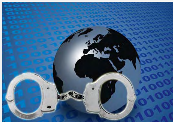
Globalno suzbijanje trgovine ilegalnim narkoticima

za borbu protiv međunarodne trgovine ilegalnim narkoticima. U dokumentu su navedena dva prioriteta: borba protiv trgovine kokainom i heroinom. Takođe, pakt može da se koristi i za suzbijanje trgovine ostalih ilegalnih narkotika, pre svega marihuane i sintetičkih droga.