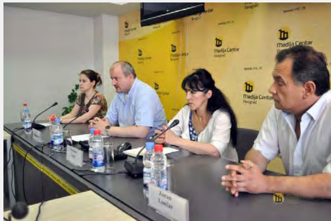
Konferencija u Medija centru