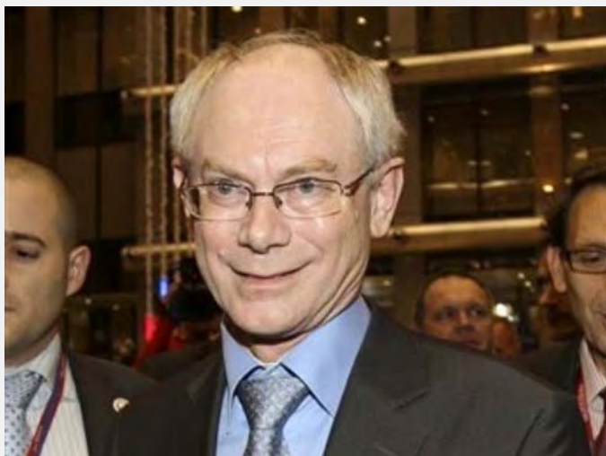
Herman van Romprij, predsednik EU

I godinu dana nakon toga, Herman van Romprij, prvi predsednik EU istakao je da su jačanje pravosudnog sistema i poboljšanje rada policije prioriteta za EU i njenu misiju na Kosovu i Metohiji. Vladavina prava je jedna od osnovnih premisa na kojima je zasnovana EU i zbog toga je uspostavljanje takve vladavine na Kosovu od velikog značaja za EU i EULEX, rekao je Rompij.