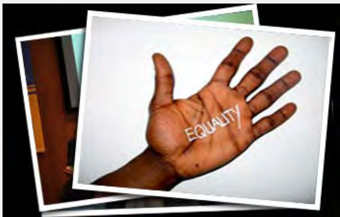
Jednaka prava za sve, Agencija za ljudska prava EU

prava, kroz judikaturu Suda pravde EU i kroz zaštitu koju garantuje Evropski sud za ljudska prava u Strazburu.