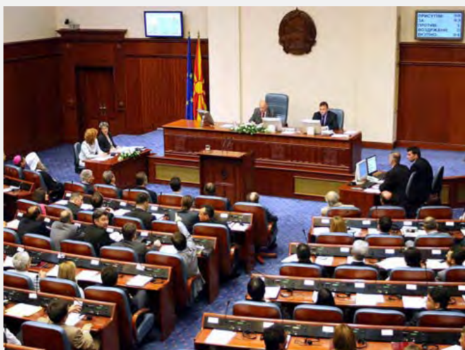
Glasanje u makedonskom parlamentu, Hronicar.net

zakona biće nadležan Ustavni sud Srbije, pošto je Zaštitnik građana najavio pokretanje postupka ocene ustavnosti. U Makedoniji situacija je slična. Branitelji ljudskih prava izrazili su svoju zabrinutost za zaštitu građanskih prava i sloboda, kao i za zaštitu privatnosti povodom usvajanja zakona o elektronskim komunikacijama 17. juna ove godine. Ovim zakonom se predviđa neprihvatljivo zadiranje u privatnost građana i ozbiljno ugrožavanje osnovnih ljudskih prava, rekao je makedonski ogranak Helsinškog odbora za ljudska prava i dodao da je ovaj potez u suprotnosti sa svim postojećim međunarodnim standardima.