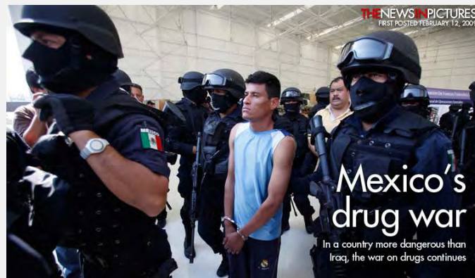
Borba protiv narko-kartela u Meksiku

jedan od glavnih ciljeva meksičke vlade je i njihovo suzbijanje. U uslovima infiltriranosti narko-kartela u sistem, putem visokog stepena korupcije na svim nivoima vlasti i de facto defragmentiranosti organa za njihovo suzbijanje (npr. policije), autor ovog eseja je mišljenja da je pozitivan ishod te borbe nemoguć bez suštinske pomoći SAD.