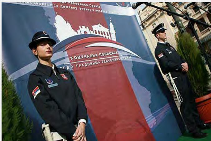
Budući pripadnici komunalne policije

Dvomesечna obuka za prvu generaciju komunalnih policajaca uspešno je završena. Očekuje se da će do kraja godine komunalni policajci patrolirati ulicama svih većih gradova u Srbiji. Obuka je započela 10. maja u Centru za osnovnu policijsku obuku u Sremskoj Kamenici i do sada ju je prošlo 78 kandidata. Ipak, prve patrole komunalne policije još uvek nisu stupile na dužnost u svim gradovima u Srbiji.