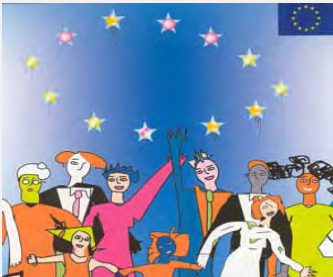
Zaštita ljudskih prava u Evropi, Avrupa.info.tr

Za razliku od pravnog sistema uspostavljenog u Savetu Evrope, EU je razvila poseban pravni poređak, čiju najvišu pravnu instancu čini Sud pravde EU, sa sedištem u Luksemburgu. Konvencija i njen sudski mehanizam se nisu, do stupanja na snagu Ugovora iz Lisabona, odnosili na EU kao celinu, iako su sve države članice potpisnice Konvencije. Kao potpisnice one su obavezne da je poštuju, kao i odluke Suda i kada primenju ili sprovode pravo EU.