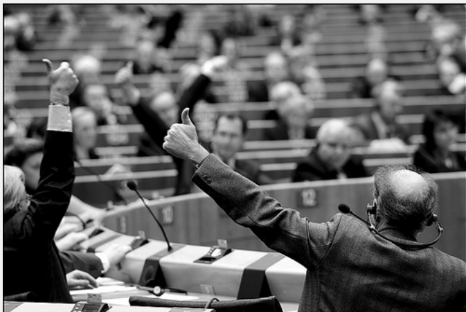
Glasanje u Evropskom parlamentu

Evropski parlament (EP) je 8. jula odobrio SWIFT sporazum kojim se uređuje razmena bankarskih podataka EU i SAD sa ciljem otkrivanja izvora i načina finansiranja terorističkih aktivnosti. EP je u februaru ove godine odbacio prvu verziju sporazuma zbog nedovoljnih garancija zaštite privatnosti, tj. podataka o ličnosti. Ipak, posle određenih ustupaka SAD, sporazum je usvojen na zasedanju EP sa 484 glasova za, 109 protiv i 12 uzdržanih. Ovu odluku EP pozdravio je i Barak Obama, predsednik SAD. Ukazao je na to da ovaj sporazum pruža dodatne mere zaštite privatnosti, a istovremeno omogućava nastavak borbe protiv terorizma.