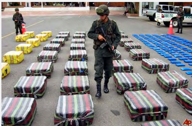
Borba protiv narko-kartela u Kolumbiji

vne službenike. Posle 2000. godine i odlaska revolucionarne partije PRI (spa. Partido Revolucionario Institucional ) sa vlasti politička volja za suzbijanjem ovih moćnih organizacija postaje jasnije izražena nego ranije. Međutim, aktivnost kartela je na vrhuncu i u toj činjenici autor traži analogiju sa Kolumbijom od pre dvadeset godina kada je delovanje tamošnjih kartela cvetalo.