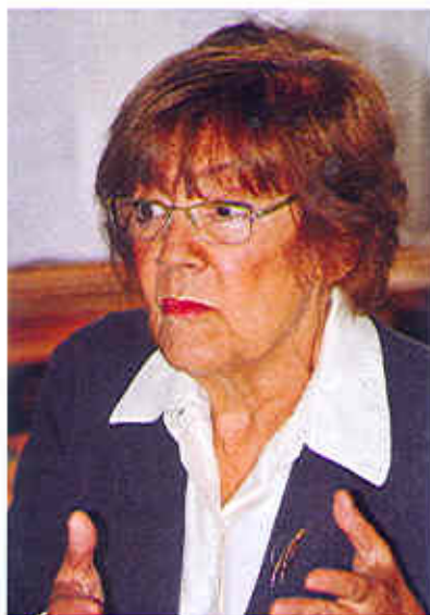
VESNA PEŠIĆ: Kad čitate Strahovladu prepoznajete stvarnost Titovog vremena, Miloševića, vlade posle 5. oktobra i danas

U Beogradu 1985. osnivamo Helsinški komitet za ljudska prava. Čak je i Dobrica Ćosić sa akademikima formirao čuveni Fond za slobodu izražavanja. Ivan Janković je 1981. pokušao da organizuje prvo udruženje za borbu protiv smrtno kazne, uspelo je 1987.